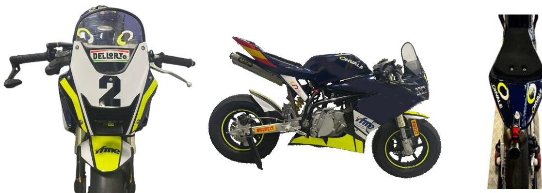
Imagen OHVALE GP 0-160

Código de color carenado: Toyota 8L7 Dark Blue