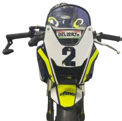
Imagen OHVALE GP 0-160